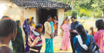
किए जा रहे इन प्रयासों के लिए विद्यालय को देश के 75